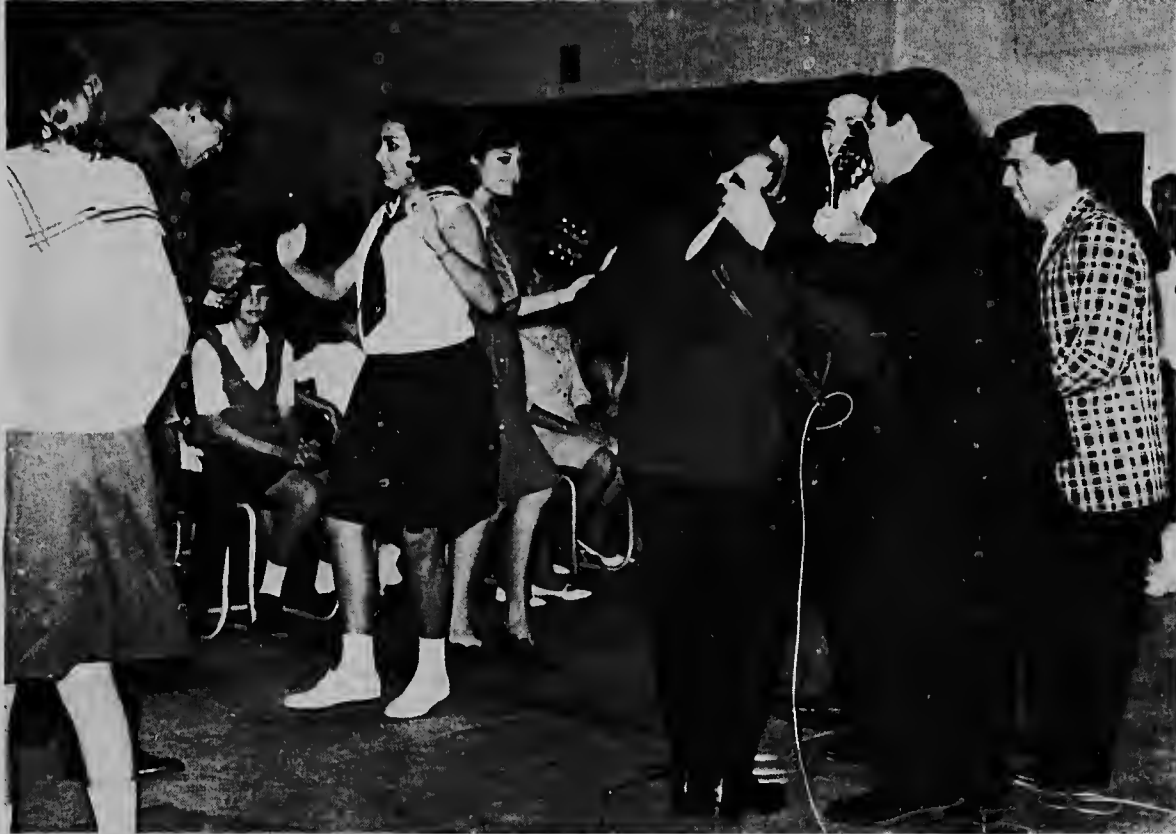
Diahuebs mainta e teenagersband procedente di Venezuela "Los Blonder" a jega Aruba y mesun anochi a anima un show masha alegre den Club Estrella na Santa Cruz. E foto ta muestra "Los Blonder" tocando y algun pareha cu a participa den e concurso di balle. E show di ayera nochi a worde comprati tambe cu e gruponan local di Aguinaldos, "Estrella di oro," Voces Tucuseros" y Claveles Navideños." Ayera nochi, awe nochi y mayan den dia "Los Blonder" lo aparece den mas shownan juvenil na Aruba.

PETRONA & CROES ARUBA N.V. Ananastraat 4 Tel 2800